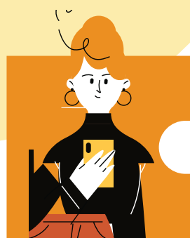
Emprendimiento en solitario